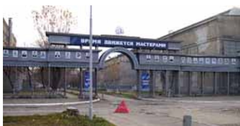
Доска почета ОАО «Кумз»

КУФ ООО «А.Д.Д. Сервис» создан на базе энергослужбы металлургического завода (цех высоковольтных сетей и подстанций и цех тепловодоснабжения), численность сотрудников этих служб составляет 200 человек. Все рабочие – высококвалифицированные, имеют опыт работы на металлургических предприятиях и в сфере энергетики.